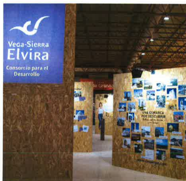
Feria de los Pueblos 2019