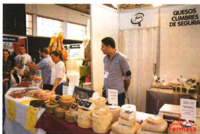
Foto de archivo Feria de los Pueblos 2019