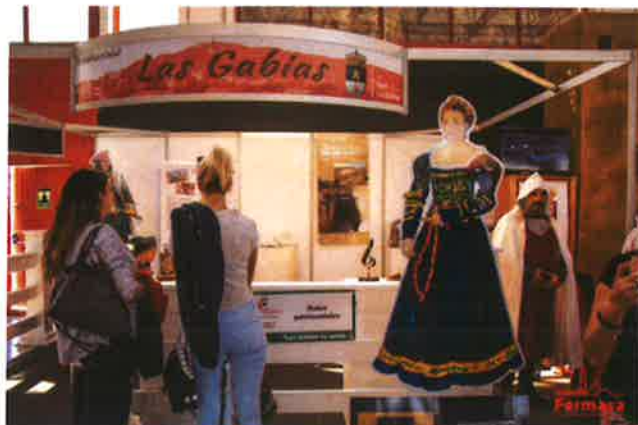
Foto de archivo Feria de los Pueblos 2019