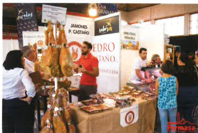
Foto de archivo Feria de los Pueblos 2019