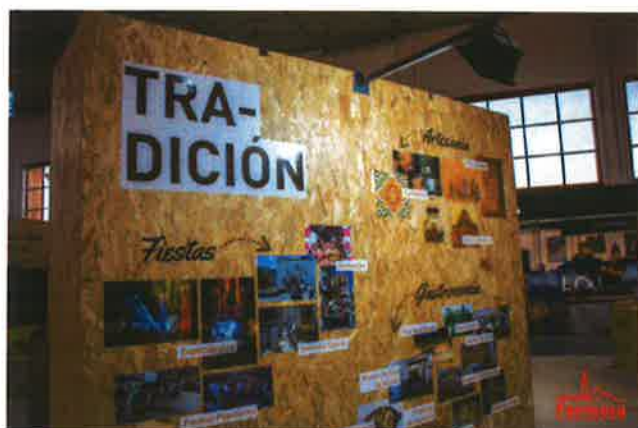
Foto de archivo Feria de los Pueblos 2019