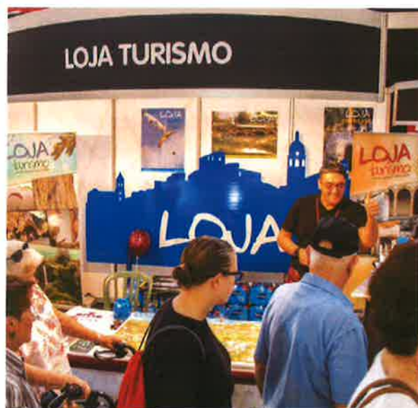
Foto de archivo Feria de los Pueblos 2019