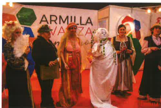
Foto de archivo Feria de los Pueblos 2019