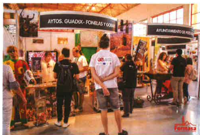
Foto de archivo Feria de los Pueblos 2019